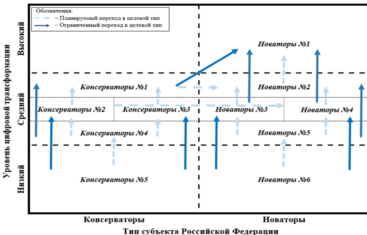
Рисунок 5. Матрица диффузии инноваций в субъектах Российской Федерации

Исходя из структуры значений Субиндексов и достигнутого уровня цифровой трансформации возможно выделение целевого типа субъекта Российской Федерации, переход в который позволит повысить уровень цифровой трансформации экономики Российской Федерации на мезоуровне. В исследовании разработана матрица диффузии инноваций как проекция цифровой трансформации экономики Российской Федерации на мезоуровне – рисунок 5.