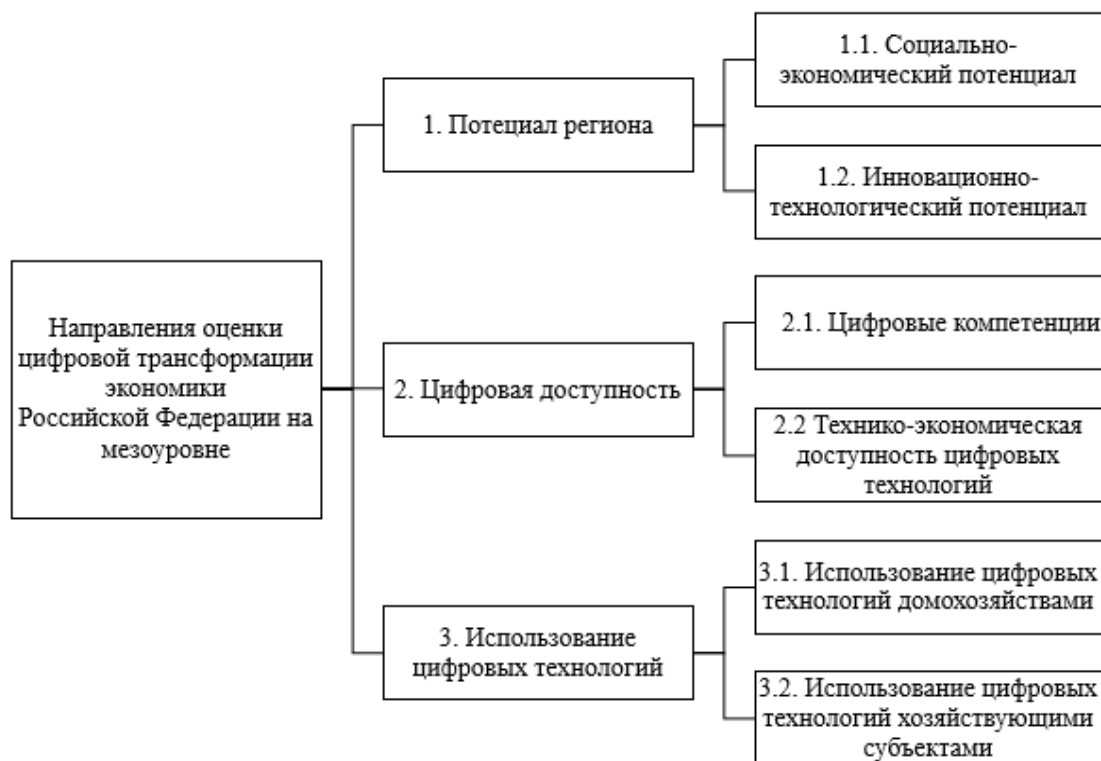
Рисунок 4. Направления оценки цифровой трансформации экономики Российской Федерации на мезоуровне

мультиэтнический характер российского общества, а также достаточно высокий уровень автономии субъектов Российской Федерации выделены направления оценки цифровой трансформации экономики на мезоуровне [9] – рисунок 4.