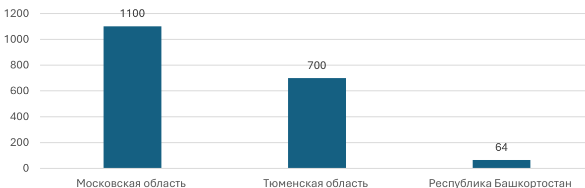
Рисунок 5. Субъекты РФ, занявшие третье место в Национальном рейтинге состояния инвестиционного климата регионов в 2024 г. по количеству запущенных инвестиционных проектов за 2024 г., кол. проектов.

Институциональный потенциал Тюменской области достиг нового уровня: в первом полугодии 2024 г. число реализованных инвестиционных проектов увеличилось на 50% в сравнении с первым кварталом 2023 г., достигнув объема в 47,8 млрд рублей. Регион акцентирует внимание на развитии нефтегазового и нефтехимического кластеров, биотехнологий, туризма, строительства и креативных индустрий. Для стимулирования бизнеса в регионах организуются инвестиционные туры, где предприниматели муниципальных образований демонстрируют потенциал территорий и перспективные бизнес-ниши муниципалитета. Стимулом для развития муниципальных образований можно признать рейтинг инвестиционной привлекательности муниципалитетов, по итогам которого лидерам представляются гранты от 1 до 10 млн рублей, в зависимости от их позиций. В конце 2023 г. Ялуторовский муниципальный район занял первое место и получил грант в размере 10 млн рублей.