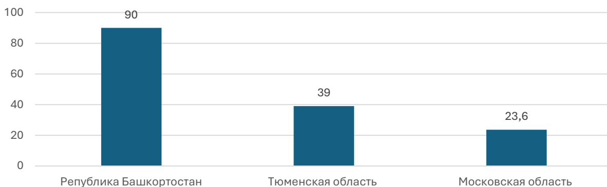
Рисунок 4. Субъекты РФ, занявшие третье место в Национальном рейтинге состояния инвестиционного климата регионов в 2024 г. по количеству президентских грантов за 2024 г., млн руб.

Институциональный потенциал Тюменской области достиг нового уровня: в первом полугодии 2024 г. число реализованных инвестиционных проектов увеличилось на 50% в сравнении с первым кварталом 2023 г., достигнув объема в 47,8 млрд рублей. Регион акцентирует внимание на развитии нефтегазового и нефтехимического кластеров, биотехнологий, туризма, строительства и креативных индустрий. Для стимулирования бизнеса в регионах организуются инвестиционные туры, где предприниматели муниципальных образований демонстрируют потенциал территорий и перспективные бизнес-ниши муниципалитета. Стимулом для развития муниципальных образований можно признать рейтинг инвестиционной привлекательности муниципалитетов, по итогам которого лидерам представляются гранты от 1 до 10 млн рублей, в зависимости от их позиций. В конце 2023 г. Ялуторовский муниципальный район занял первое место и получил грант в размере 10 млн рублей.