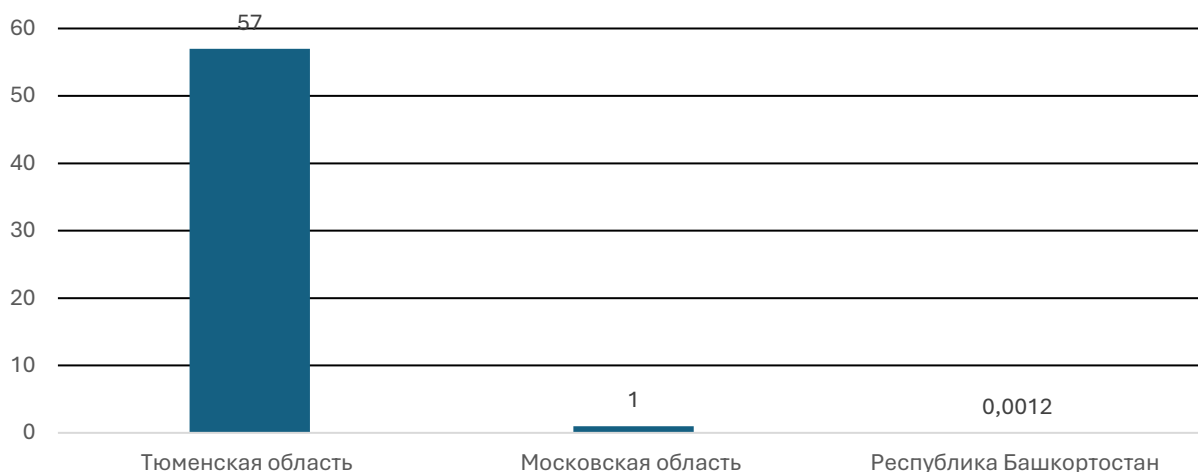
Рисунок 1. Субъекты РФ, занявшие третье место в Национальном рейтинге состояния инвестиционного климата регионов в 2024 г., по суммарному запасу торфа за 2024 г., млрд т.

Трудовой потенциал Тюменской области за 2023-2024 гг. демонстрирует следующие показатели: уровень безработицы к концу 2023 г. составил 3,1%. Уровень Трудоустройства населения в этот же период достиг 77,2%, при этом в службу за трудоустройством обратились 43 тысячи местных жителей, из которых нашли работу 33,5 тысячи. Запрос работодателей на новые кадры к завершению года оценивается в 21 тысячу специалистов, что соответствует показателю 6,5 вакансий на каждого ищущего работу. Наибольшую популярность среди работодателей набирают профессии, связанные со строительством, промышленностью и транспортом. К сентябрю 2024 г. средняя предлагаемая зарплата в Тюменской области достигла отметки в 67 087 руб., что на 12% больше показателя начала года и соответствует увеличению на 7 087 рублей.