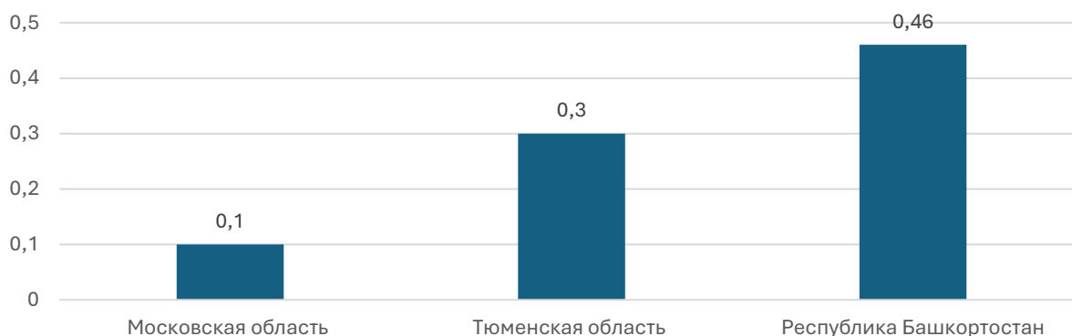
Рисунок 2. Субъекты РФ, занявшие третье место в Национальном рейтинге состояния инвестиционного климата регионов в 2024 г. по уровню безработицы за 2024 г., %

Трудовой потенциал Тюменской области за 2023-2024 гг. демонстрирует следующие показатели: уровень безработицы к концу 2023 г. составил 3,1%. Уровень Трудоустройства населения в этот же период достиг 77,2%, при этом в службу за трудоустройством обратились 43 тысячи местных жителей, из которых нашли работу 33,5 тысячи. Запрос работодателей на новые кадры к завершению года оценивается в 21 тысячу специалистов, что соответствует показателю 6,5 вакансий на каждого ищущего работу. Наибольшую популярность среди работодателей набирают профессии, связанные со строительством, промышленностью и транспортом. К сентябрю 2024 г. средняя предлагаемая зарплата в Тюменской области достигла отметки в 67 087 руб., что на 12% больше показателя начала года и соответствует увеличению на 7 087 рублей.