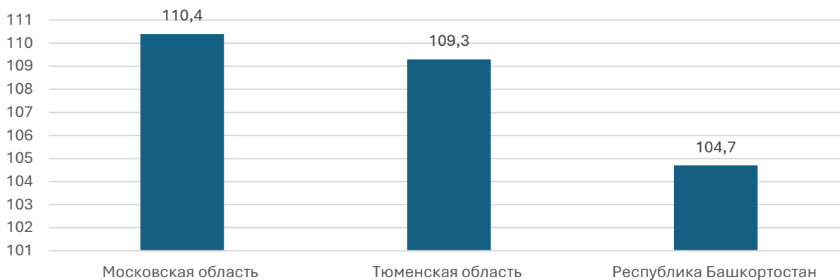
Рисунок 3. Субъекты РФ, занявшие третье место в Национальном рейтинге состояния инвестиционного климата регионов в 2024 г. по индексу промышленного производства за 2024 г., %

Производственный потенциал Тюменской области также демонстрирует устойчивое развитие. В первом полугодии 2024 г. показатели промышленного производства достигли 102,4% по сравнению соответствующим периодом прошлого года. Отличились производители электрооборудования (129%), автотранспортных средств, прицепов и полуприцепов (119,3%), резиновых и пластмассовых изделий (111%) и пищевых продуктов (110,8%).