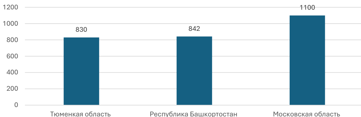
Рисунок 6. Субъекты РФ, занявшие третье место в Национальном рейтинге состояния инвестиционного климата регионов в 2024 г. по числу аварийных домов за 2024 г., кол. домов.

Инфраструктурный потенциал Тюменской области представляет собой комплекс мероприятий, среди которых выделяются: успешная реализация программы по переселению из аварийного жилья, завершенная досрочно в 2023 г., с бюджетом свыше 11 млрд рублей; строительство Южного обхода Тюмени; развитие дорожной инфраструктуры: к 2024 г. запланировано расширение и модернизация дороги Тюмень-Тобольск, чтобы сделать её современной, четырёхполосной и безопасной, а также решить проблему перегруженности южного Обхода Тюмени, который свяжет федеральные трассы Екатеринбург - Тюмень и Тюмень-Омск; обновление коммунальной инфраструктуры: в 2023-2024 гг. будет осуществлена государственная программа Тюменской области «Модернизация систем коммунальной инфраструктуры», цель которой - увеличить численность населения, для которого улучшится качество коммунальных услуг, увеличить объем работ по замене инженерных сетей и уменьшить вероятность аварий на коммунальных объектах.